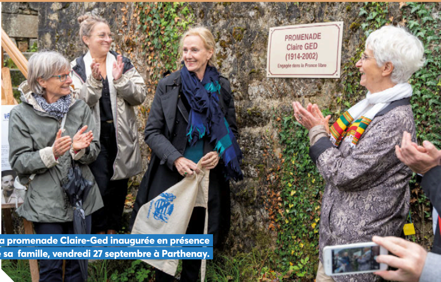
La promenade Claire-Ged inaugurée en présence de sa famille, vendredi 27 septembre à Parthenay.