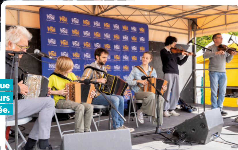
Les élèves de l'école de musique de Parthenay-Gâtine ont fait chanter leurs instruments pour donner le LA de la rentrée.