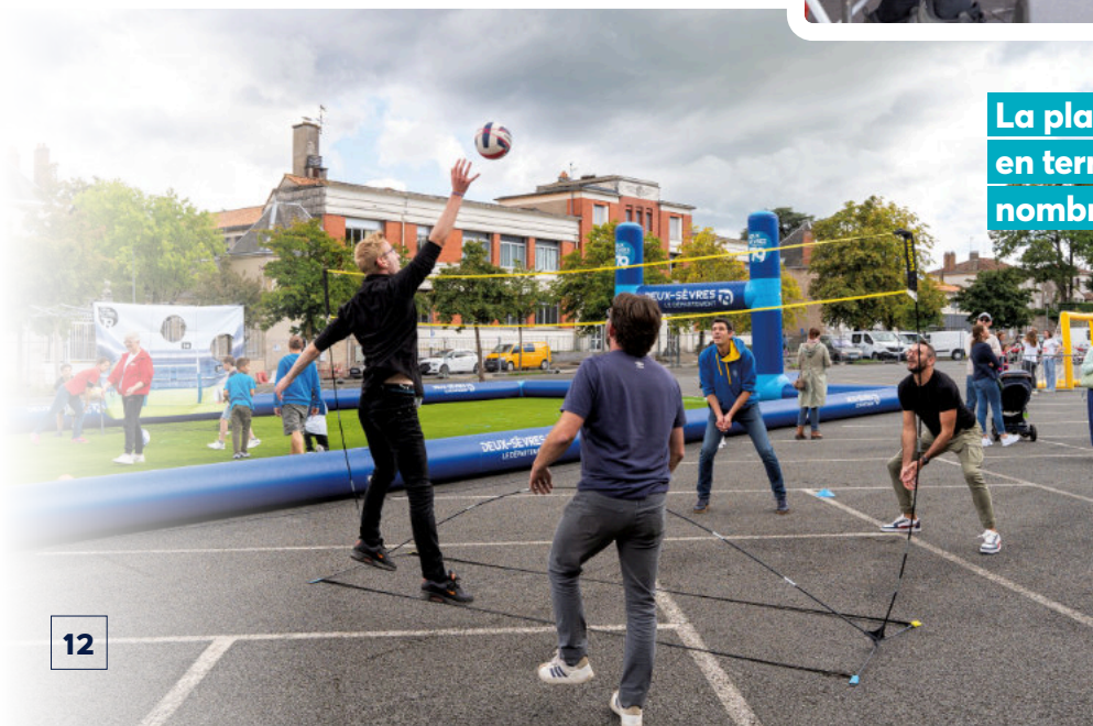
La place du Drapeau s'est transformée en terrain de sport géant avec de nombreux espaces d'initiations.