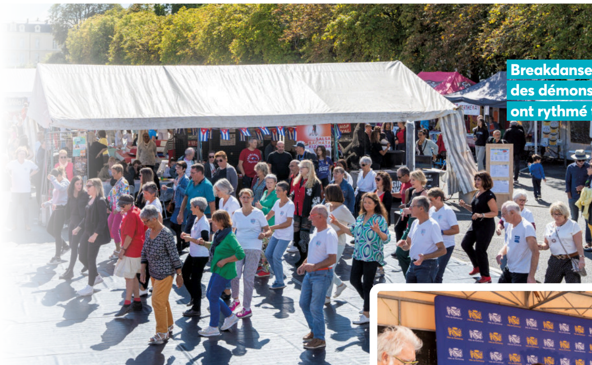
Breakdansen, rock, lindy-hop : des démonstrations de danses ont rythmé toute la journée.

Samedi 7 septembre, 89 associations ont pris part à la cinquième édition de Un record, qui illustre le dynamisme sportif, culturel, et social de notre territoire.